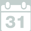
URGENCIAS: LAS 24 HORAS DEL DÍA, LOS 7 DÍAS DE LA SEMANA Y LOS 365 DÍAS DEL AÑO