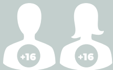
PACIENTES ADULTOS (MAYORES DE 16 AÑOS)